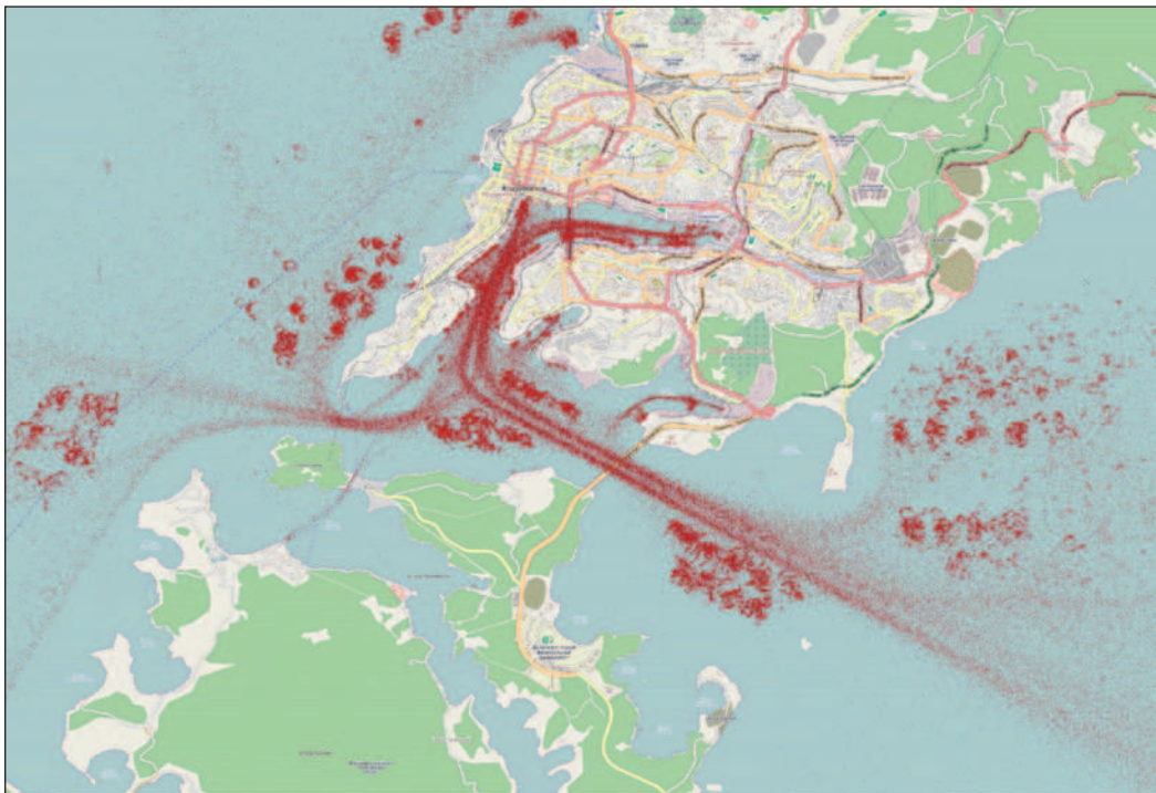
Рис. 2. Данные о движении судов в акватории порта «Владивосток» летом 2013 г.

Полученные данные о судах проходят обработку для приведения к истинным временным отметкам (с точностью до минуты). При этом отбрасывается множество дублирующихся данных, которые возникают, например, если с сайта в первую минуту получена информация с возрастом в 2 мин, а во вторую минуту — информация об этом же судне с возрастом в 3 мин. В этом случае обе записи относятся к одному и тому же моменту времени и соответственно не несут никакой дополнительной информации. Статистика, собранная за сентябрь 2012 г., показала, что из примерно 1 600 000 записей с информацией о положении судна, лишь 512 000 (примерно треть) являются уникальными.